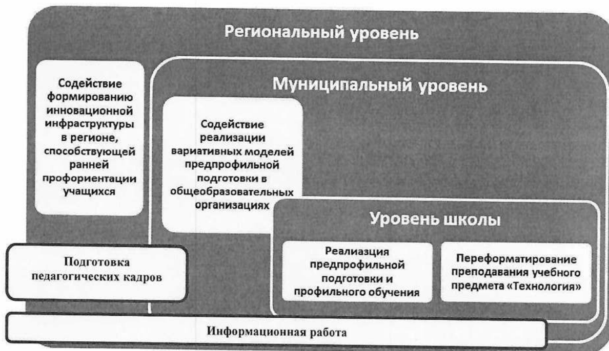
Схема 1. Приоритетность запуска механизмов ранней профориентации на разных уровнях региональной системы образования

обозначены уровни запуска того или иного механизма ранней профориентации школьников: