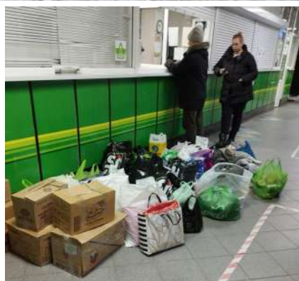
СДЭК уже с нами знаком