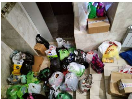
Готовимся к погрузке очередной партии гуманитарного груза

В День Героев Отечества 9 декабря лицеисты приняли участие в акции "Поздравь солдата с Новым годом!". Ребята собрали сорок коробок, в которые вложили сладости, письма, рисунки, и передали их инициативной группе "Своих не бросаем ХМАО" для отправки бойцам специальной военной операции. Это не первое участие в акции нашего лицея. По инициативе 8 Б класса для солдат было отправлено семь посылок общим весом около ста кг. Это теплые вещи, носки, медикаменты, продукты питания, письма, сладости. В конце ноября общими силами было собрано и отправлено еще 235 кг груза. В него вошли предметы первой необходимости для солдат. Выражаем огромную благодарность всем учащимся, родительским комитетам, сотрудникам лицея, принявшим участие в акции!