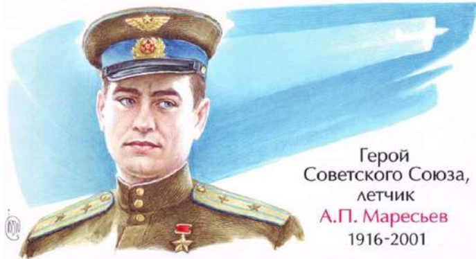
Герой Советского Союза, лётчик А.П. Маресьев 1916-2001

В истории России есть множество выдающихся людей, которые совершили подвиги во время Великой Отечественной Войны. Я хочу поведать вам об одном из них - об Алексее Маресьеве. Этот человек славен многими героическими поступками. 4 апреля 1942 немцы подбили самолет Алексея, и он упал. Несколько дней и ночей раненый лётчик полз по лесу до госпиталя. Он ел иголки ели и ягоды. Сначала этот путь он преодолевал на ногах, чувствуя невыносимую боль. Спустя некоторое время Маресьев и вовсе перестал чувствовать ноги. Несмотря на долгие мучения, Алексей своим упорством и силой воли смог добраться до госпиталя. Однажды очнувшись в госпитале, он не почувствовал боли, заглянул под одеяло... Ему ампутировали ноги. Алексей не пал духом. Лётчику пришлось учиться ходить на деревянных протезах. Как известно с протезами летать нельзя. И Алексей упорно упрасивал не списывать его со службы. И о чудо! Он смог сделать невозможное... Научился управлять самолетом без ног и вновь отправился на фронт лётчиком-истребителем. Несмотря на все трудности в жизни, Алексей нашел свою любовь и был счастливым человеком. Об этом лётчике написана очень хорошая книга - «Повесть о настоящем человеке». Я с огромным интересом прочитала эту книгу и рекомендую её прочесть всем своим сверстникам. Чтобы молодое поколение на примере таких людей, как Маресьев, училось мужеству, героизму и помнило о подвигах наших героев.